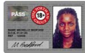
পোর্টম্যান 'থু' ইই' কার্ড