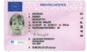
ছবি সমেত ড্রাইভিং লাইসেন্স