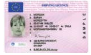
ફોટા સાથેનું ડ્રાઈવિંગ લાઈસન્સ