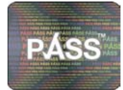
'પાસ'નું હોલોગ્રામ ચિહ્ન

મદદ કરવા માટે, ડિપાર્ટમેન્ટ ઓફ હેલ્થ તેમની સંદેશાવ્યવહારની ઝૂંબેશ મારફતે - લોકોને - ખાસ કરીને કિશોરાવસ્થાનાં લોકોને માન્યતા મેળવેલી 'પાસ' યોજના મારફતે તેમની ઉંમરનો પુરાવો સાથે રાખવો જરૂરી હોવાનું યાદ દેવડાવશે.