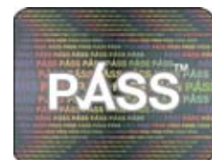
ਪਾਸ ਹੋਲੋਗਰਾਮ ਲੋਗੋ

ਮਦਦ ਕਰਨ ਲਈ, ਡਿਪਾਰਟਮੈਂਟ ਆਫ਼ ਹੈਲਥ ਲੋਕਾਂ ਤਕ - ਅਤੇ ਖ਼ਾਸ ਤੌਰ 'ਤੇ ਤੇਰਾਂ ਤੋਂ ਉੱਨੀ ਸਾਲ ਦੇ ਨੌਜਵਾਨਾਂ ਤਕ - ਸੁਨੇਹਾ ਪਹੁੰਚਾਉਣ ਦੀ ਮੁਹਿੰਮ ਚਲਾ ਕੇ ਉਹਨਾਂ ਨੂੰ ਯਾਦ ਦੁਆਉਂਦਾ ਰਹੇਗਾ ਕਿ ਉਹਨਾਂ ਨੂੰ ਆਪਣੇ ਕੋਲ ਕਿਸੇ ਪ੍ਰਵਾਨਤ 'ਪਾਸ' ਸਕੀਮ ਤੋਂ ਲਿਆ ਉਮਰ ਦਾ ਸਬੂਤ ਰੱਖਣਾ ਚਾਹੀਦਾ ਹੈ।