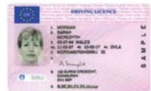
ਫੋਟੋ ਡ੍ਰਾਈਵਿੰਗ ਲਾਈਸੈਂਸ