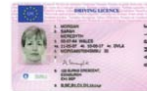
دفتر قيادة السيارة عليه صورة لصاحبه