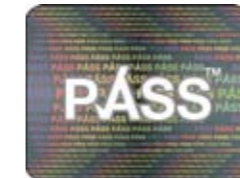
العلامة المميزة البراقة لباس